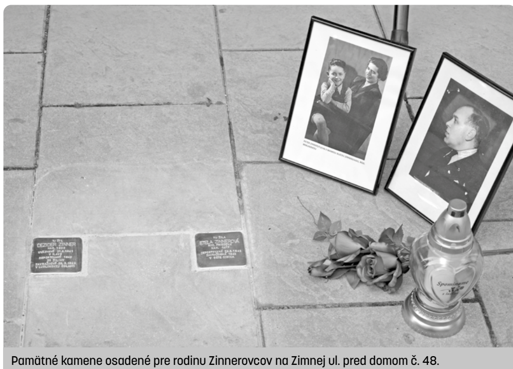
Pamätné kamene osadené pre rodinu Zinnerovcov na Zimnej ul. pred domom č. 48.

Spracovala Edita Gondová